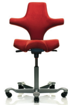
HÅG Capisco 8106