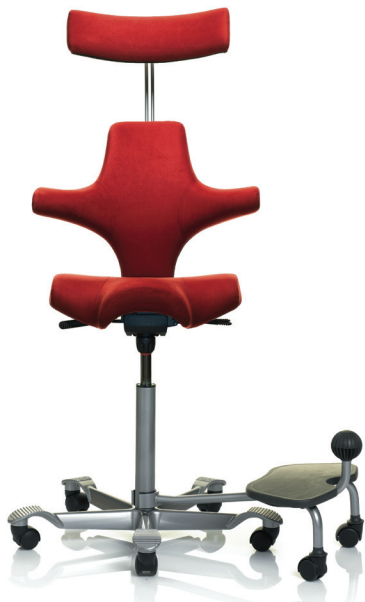
HÅG Capisco 8107 optional mit HÅG StepUp®