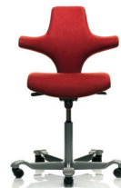
HÅG Capisco 8126