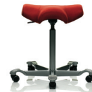
HÅG Capisco 8105