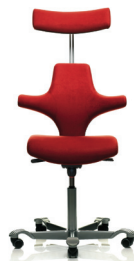
HÅG Capisco 8127