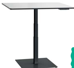
Optionale Bodenplatte 65 x 65 cm