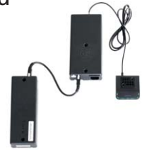
Mit optionaler großer Bodenplatte