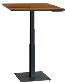
Standard-Bodenplatte 48 x 48 cm