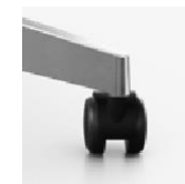
5-Arm-Fußkreuz Rollen 50 mm