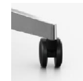
5-Arm-Fußkreuz Rollen 65 mm