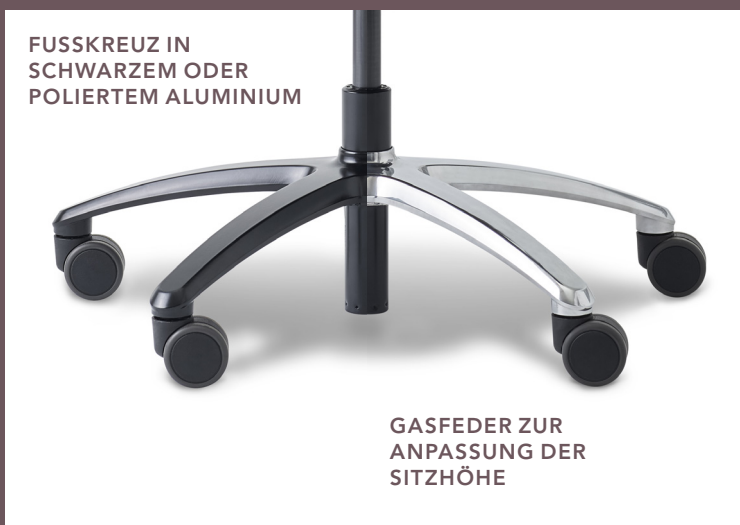
GASFEDER ZUR ANPASSUNG DER SITZHÖHE