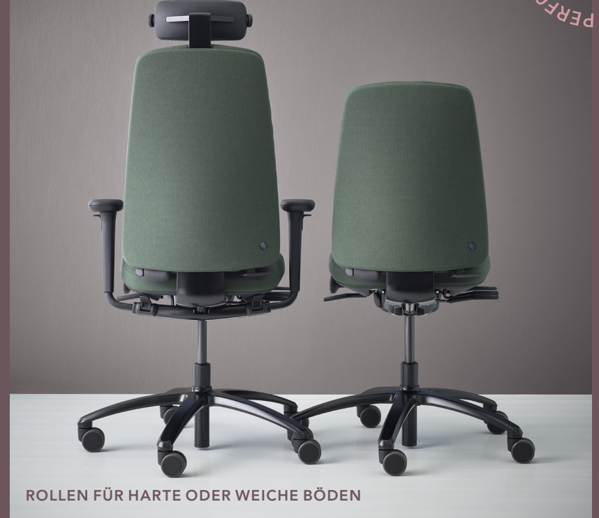
ROLLEN FÜR HARTE ODER WEICHE BÖDEN