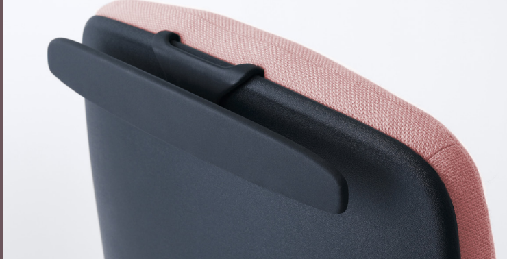
KLEIDERBÜGEL IN SCHWARZ