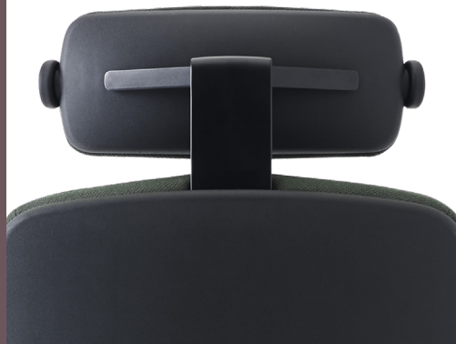
NACKENSTÜTZE IN SCHWARZEM ALUMINIUM/KUNSTSTOFF