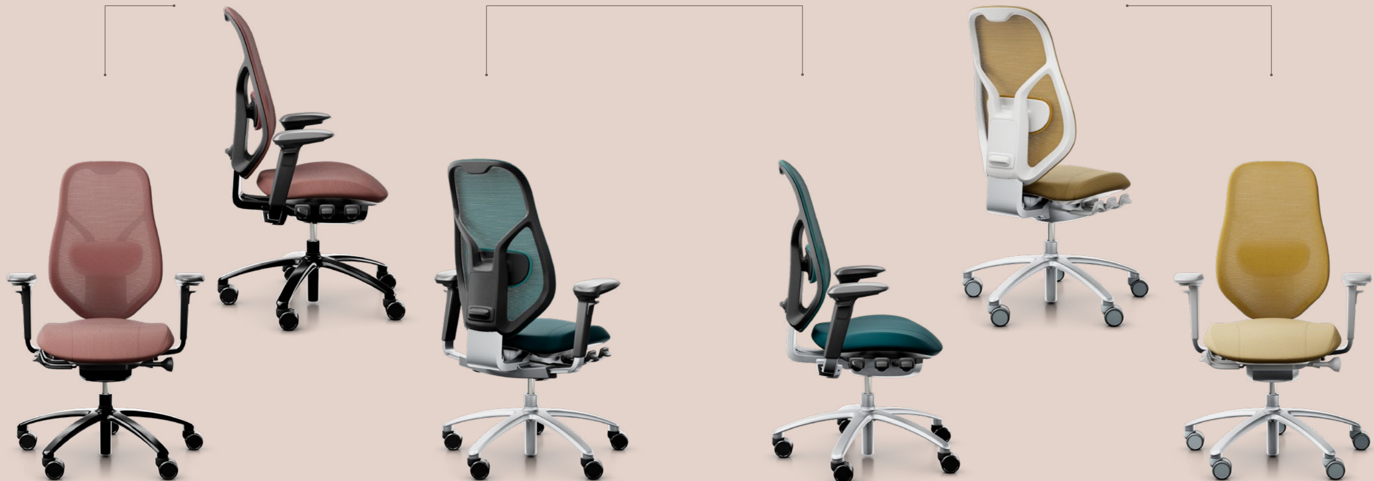
RH Mereo Mesh Silber Grau Farbe: Safran Yellow